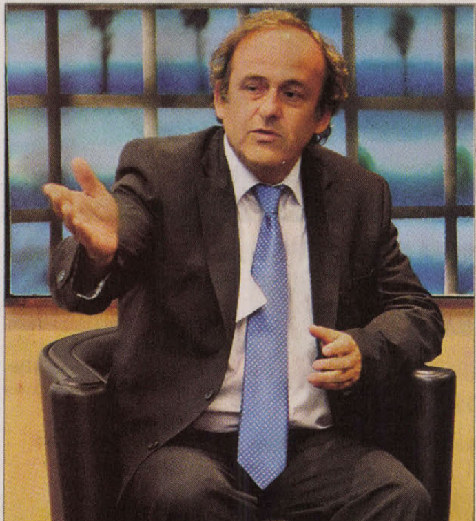
▲ Michel Platini régen a cseleivel, ma már a reformötleteivel kelt ámulatot

színpadként értékelő országok csapatairól beszélünk, hanem például a Manchester Unitedről vagy a Manchester Cityről, amely az előző idényben tavasszal egyaránt az El-ben találta magát, és miután Sir Alex Ferguson United-menedzser elmondta, csak annyit tud a kupáról, hogy a meccseket csütörtökön rendezik, a tartalékos felállásban játszó két manchesteri csapat a nyolcadöntőben könnyű nélkül kiesett. Magyarán: az UEFA megszabadulna mostohagyerekétől, kérdés azonban, az édesgyerek ugyanúgy virul-e testvér nélkül.